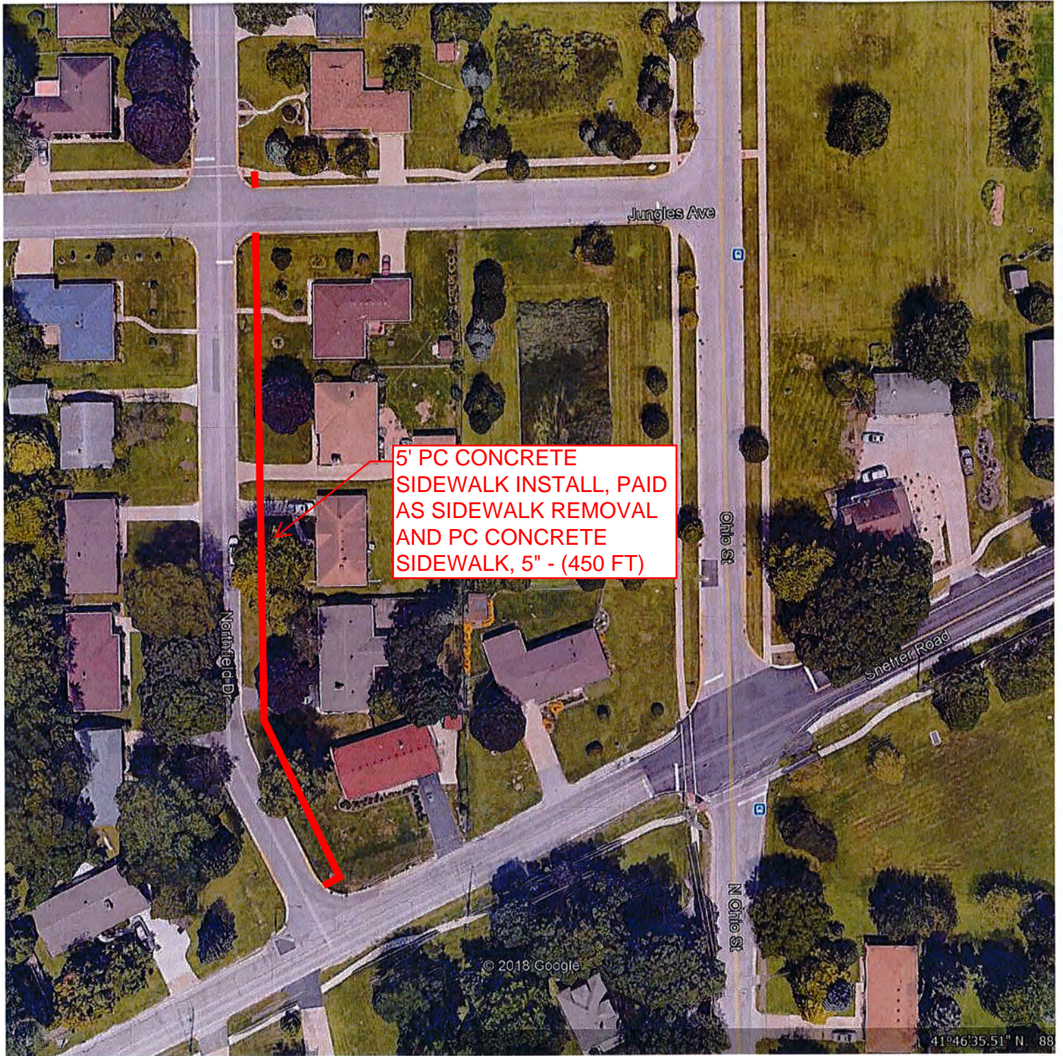
WARD 1 SIDEWALK INSTALL - NORTHFIELD DRIVE